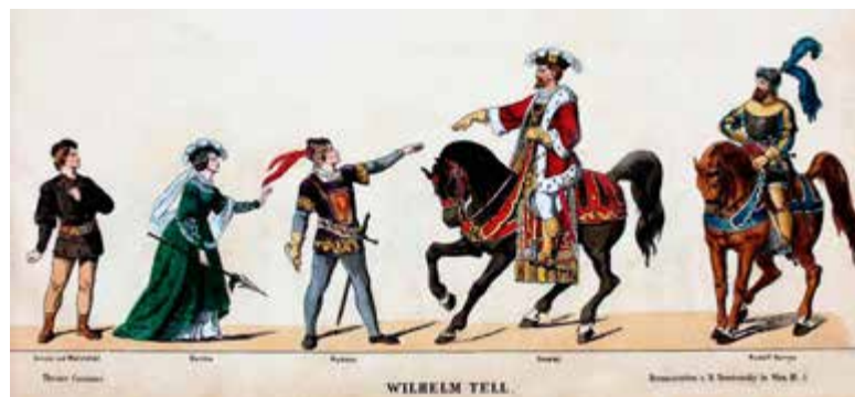
Oben: Wilhelm Tell bei Josef Trentsensky vor 1844 Unten: die spätere Fassung bei Matthäus aus dem Bostoner Band