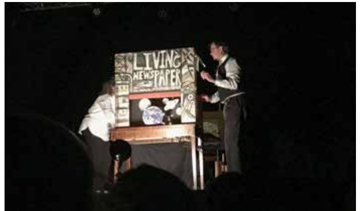
Great Small Works auf der großen Bühne in Charleville, 2018

Unter den Compagnien kann man ein großes Gerangel um die Aufmerksamkeit der „programmateurs“ beobachten. Andererseits gibt es für diese Compagnien aber auch eine staatliche Förderung, die eine solide Existenzgrundlage bilden kann. Das heißt also, es gibt in Frankreich einen Markt und eine Möglichkeit für Profis kleinerer Produktionen. Das dies im Zuge eher nachlassender Kulturförderung wie überall ein schwieriges und mühsames, meistens eher prekäres Unterfangen ist, kann man sich vorstellen.