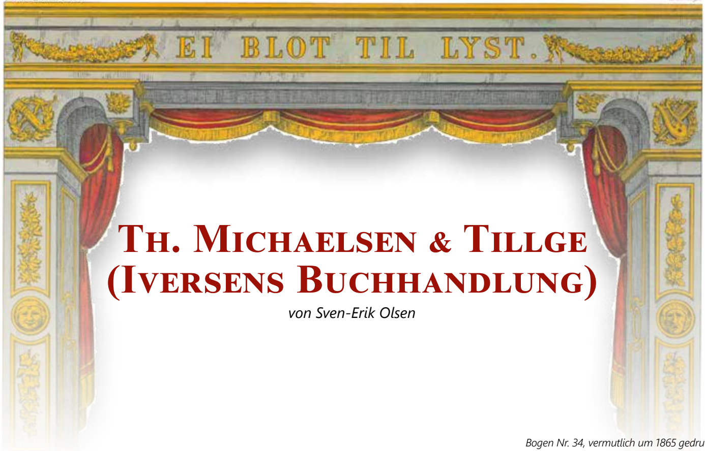
Bogen Nr. 34, vermutlich um 1865 gedruckt

Wenn man sich mit dänischer Papiertheatergeschichte befasst, geht es in der Regel immer um Alfred Jacobsen und „Suffløren“ und Carl Aller mit „Familie Journalen“ und dem Pegasus-Theater. Es gibt aber auch andere Verlage, die schon vor Jacobsen und Aller Papiertheaterbogen herausgaben, wenngleich nicht annähernd im selben Umfang.