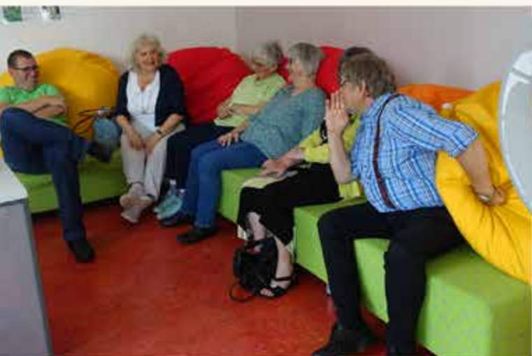
Nette Gespräche am Rande