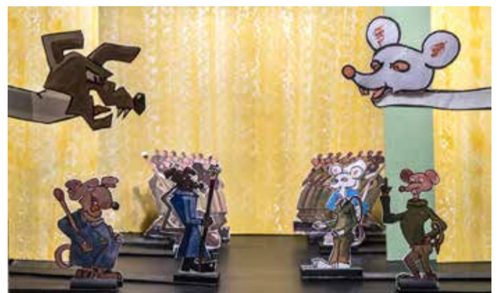
Willibald kehrt zurück , 2018