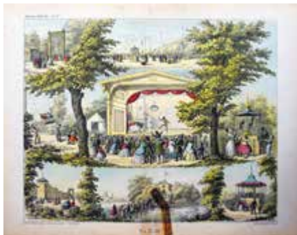
Tivoli Pantomimeteater , Nr. 13, gedruckt zwischen 1863 und 1865

Da auch der Jordans Verlag Mitte der 1870er Jahre begonnen hatte, Papiertheaterbogen herauszugeben und Alfred Jacobsen sich 1874 etablierte, ist es ziemlich wahrscheinlich, dass Tillge sich seit Anfang der 1870er Jahre mit dem Druck neuer Bilderbogen zurückgehalten hat.