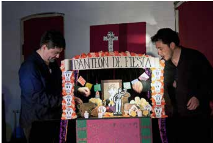
Facto teatro: Pantheon de Fiesta, 2010

Ja, ich glaube wirklich, dass Preetz mein Lieblingsfestival wäre, auch wenn ich nicht selbst so involviert gewesen wäre ... sehr hypothetisch, weil alle schwer vergleichbar sind und es, international betrachtet, ja nichts Vergleichbares gibt, d.h. in der Beständigkeit wie Preetz sie bietet und in der Fülle des Neuen, das es dort zu sehen gibt.