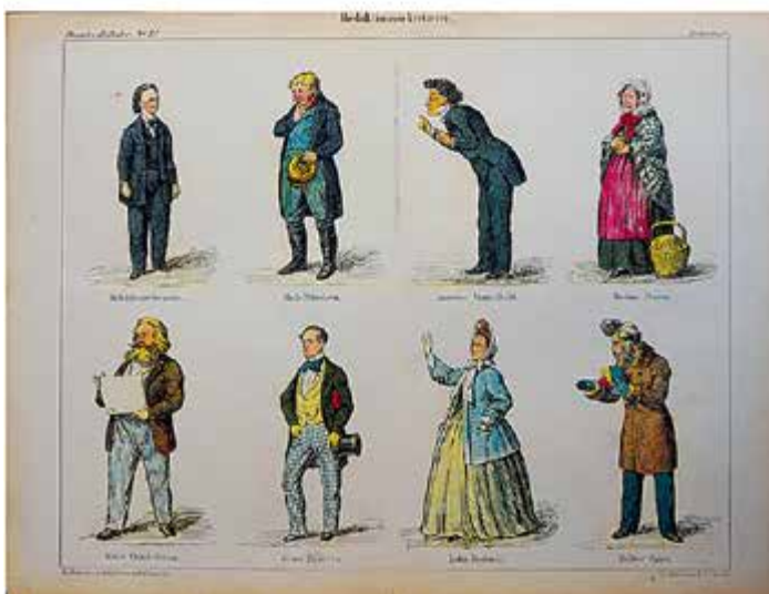
Von oben nach unten: Figuren zu Svend Dyrings Hus und Jacob von Thyboe , zwei Vorstellungen am Königlichen Theater (Det kongelige Teater), während Redaktionssekretären am Folketeatret aufgeführt wurde. Alle drei Vorstellungen fanden im Zeitraum von 1863 bis 1865 statt.