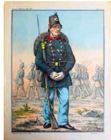
Oben: Bogen Nr. 1 in der Reihe der Dänischen Bilder von Michaelsen & Tillge, herausgegeben 1863. Links sieht man zwei Ausgaben von Bogen Nr. 3 aus dem selben Jahr. Der linke Bogen wurde von C. Ferslew & Co. Litografisk Institut gedruckt. Rechts sieht man eine spätere Ausgabe desselben Bogens – in einer erheblich schlechteren Qualität – gedruckt von Emil Bærentzen & Co. Litografisk Institut.

Der Text erschien im Original in Suffløren Heft 3, 2018 und wurde aus dem Dänischen ins Deutsche übersetzt von Lise Dybdahl-Müller.