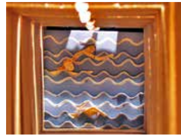
Hana Voriskova: Die Reise, 2007

für so viele unterschiedliche Talente, ob in Schauspiel, Illustration, Bühnenbau, Musik, Inszenierung, Texten. Beeindruckt und bewegt werden gleichermaßen von ganz einfachen kleinen Stücken – ich erinnere mich z.B. an ein Projekt des Kieler Ernst-Barlach Gymnasiums, alles von den Schülern entwickelt, die Geschichte, die Figuren, das Bühnenbild, das von allen Vorkenntnissen unbelastete Spiel, mal eben mit der Hand reingegriffen und eine Figur rausgeholt usw., oder aber an das Stück des bekannten amerikanischen Schriftstellers und Illustrators Brian Selznick, das ich in NY gesehen habe, (und der fast mal nach Preetz gekommen wäre ...), der die Geschichte der Christine Jørgensen, die Geschichte der ersten Geschlechtsumwandlung erzählt.