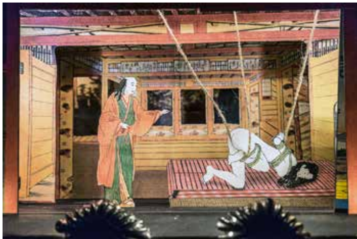
Little Blue Moon Theatre: Japanese Ghost Story , 2014

In Frankreich habe ich in den letzten Jahren einige sehr groß dimensionierte Papiertheaterstücke gesehen, die mich nicht überzeugten, weil sie irgendwie so schwerfällig, hölzern wirkten.