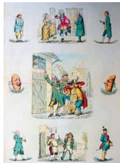
Holbergiana , Nr. 19, gedruckt zwischen 1863 und 1865