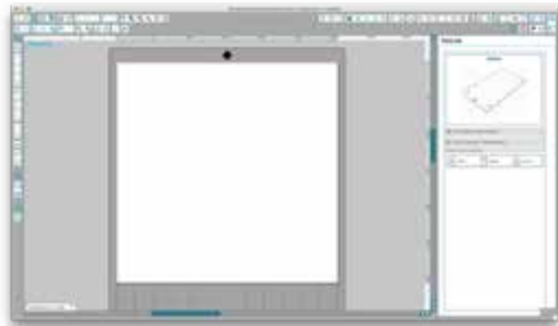
PixScan-Menü: Datei importieren

Nun öffnet man das Silhouette-Studio und wählt das PixScan-Menü aus. Mit einem Klick auf den Button „PixScan-Bild aus Datei importieren“ öffnet sich ein Fenster, dann kann der Scan vom PC geladen werden.