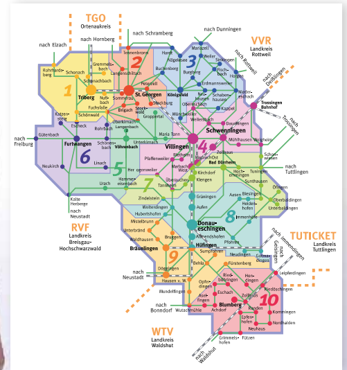
VSB-Zonen 1 bis 10

weitere Informationen unter www.v-s-b.de