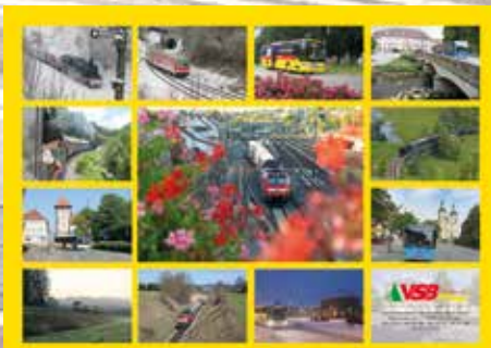
Neuer VSB Kalender 2019 sofort kostenlos erhältlich