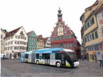
VSB dialog Elektrobusse im Schwarzwald-Baar Kreis