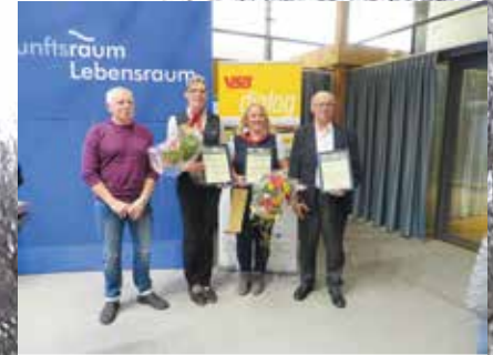
VSB Busfahrer/in des Jahres inklusive Sonderpreis